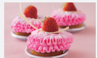
4月のおすすめケーキ「タルト・オー・フリーズ」