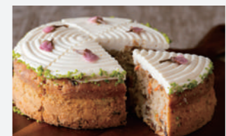
3月のおすすめケーキ「桜のキャロットケーキ」※1ピースでの販売です。