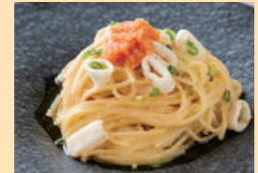
いかと明太子の和風パスタ【ディナー限定】

福岡県の自然を背景に概ね20ヶ月丁寧に育てられた和牛。肉質が柔らかく、濃厚な旨味が口中に広がる美味しさが特徴です。今回のフェアでは、ディナータイム限定でローストビーフとしてじっくり焼き上げ提供いたします。シェフおすすめの一品です。