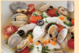
玄界灘産天然真鯛のアクアパッツァ

国産のもつを使い、スープは出汁・薄口しょうゆ・みりん・砂糖などで本場の味を再現しました。