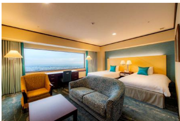
デラックスツインルーム（南側）