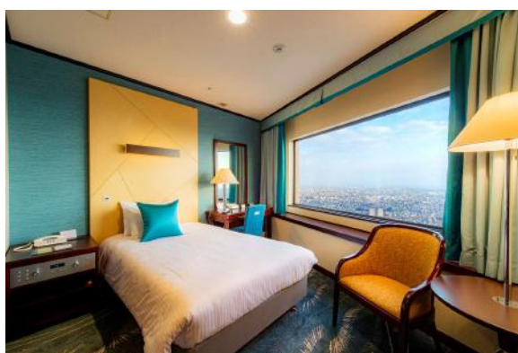
シングルルーム（南側）