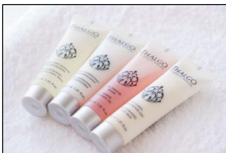
フランス製 タルゴ バスアメニティ