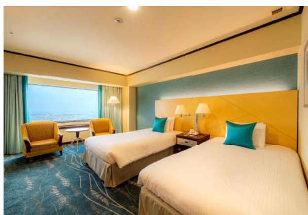
ツインルーム（南側）

『アッパープレミアムコンフォートフロア』は32階から44階に位置する客室フロアの最上階2フロアに位置し、他フロアに比べより快適さを追求した上質なフロアです。