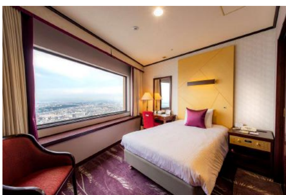
シングルルーム（北側）