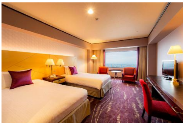
ツインルーム（北側）

カーペットデザインのコンセプトは「音楽と海」。ピアノの鍵盤をモチーフに、遠州灘にさざめく波や、風によって生みだされる砂丘の風紋をイメージしております。躍動感あるデザインで、音楽と自然がコラボレーションした、地元浜松ならではのデザインです。また両フロアともに、南側の客室は海をイメージしたブルー、北側の客室は温かみのあるパープルを基調としています。また滞在を存分にお楽しみいただける特別アメニティとして、「今治タオル」「ダイソン ヘアドライヤー」、および「フランス製 タルゴ バスアメニティ」を、今回初めて採用いたしました。