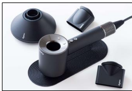
ダイソン ヘアドライヤー