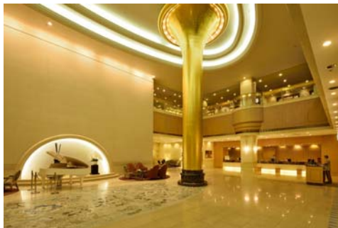
会場 ホテル1階ロビー