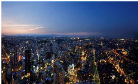
45階展望回廊からの夜景（北側）