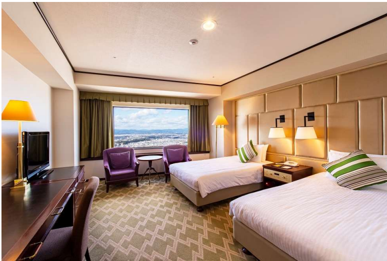
客室 プレミアムコンフォートツインルーム (北側客室)