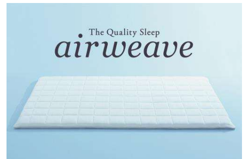
エアウィーヴマットレスを設置しております