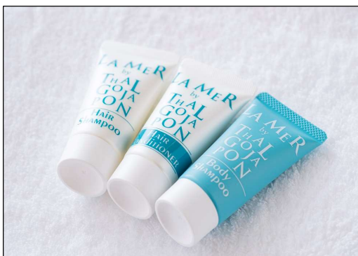
タルゴジャポン 特別アメニティ