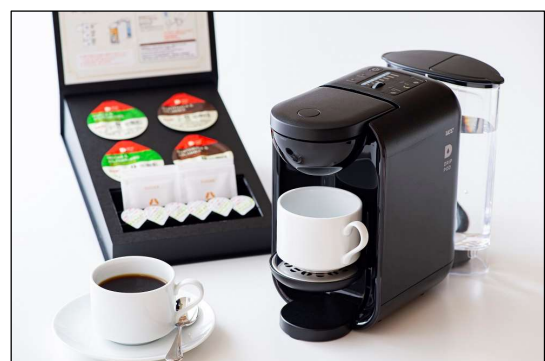
コーヒーマーカー