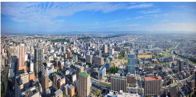
客室からの眺望 (イメージ)