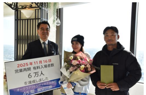
前回 入場者6万人達成時（2025年11月16日）