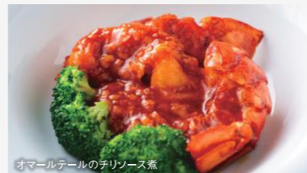
オマールテールのチリソース煮