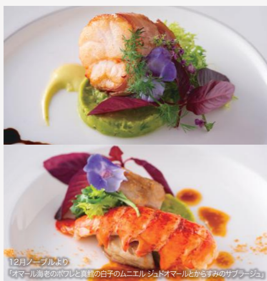
12月ノーブルより 「オマール海老のポワレと真鱈の白子のムニエル ジュドオマールとからすみのサブラージュ」