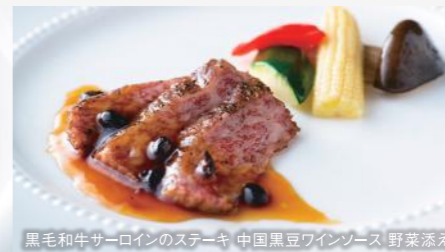
黒毛和牛サーロインのステーキ 中国黒豆ワインソース 野菜添え

LUNCH 桃花林ランチセット お一人様 2,500円 桃花林ランチコース お一人様 4,000円 (日本料理)おまかせ彩御膳 お一人様 2,800円 (日本料理)山里弁当 お一人様 4,000円 (洋食)フィガロランチセット お一人様 2,500円 (洋食)フィガロランチコース お一人様 3,500円