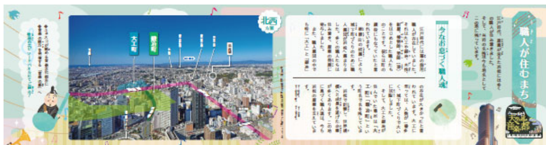
窓下パネルイメージ