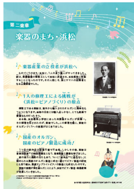
壁面パネルイメージ