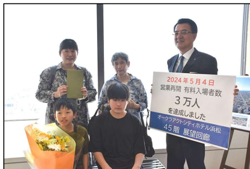
前回 入場者3万人達成時（2024年5月4日）